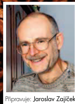
Připravuje: Jaroslav Zajíček

Většina lidí odpovídá na tuto otázku ANO. Nicméně já mohu zodpovědně prohlásit, že obě dvě kávy, které jsem v průběhu svého života měl, jsem vypil na schůzích ROH ještě za bývalého režimu a pil jsem je proto, že tak činili všichni. Já prostě rezavou vodu nemám rád. Jsem v tom ale zřejmě atypický, protože většina lidí kávu miluje.